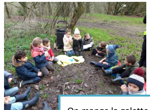
On mange la galette des rois.

Qu'est-ce qu'on fait à l'école du dehors en hiver ?