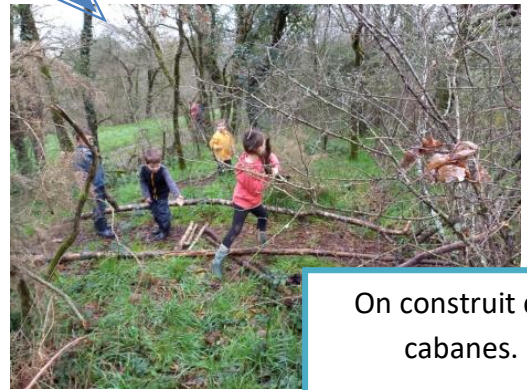
On construit des cabanes.