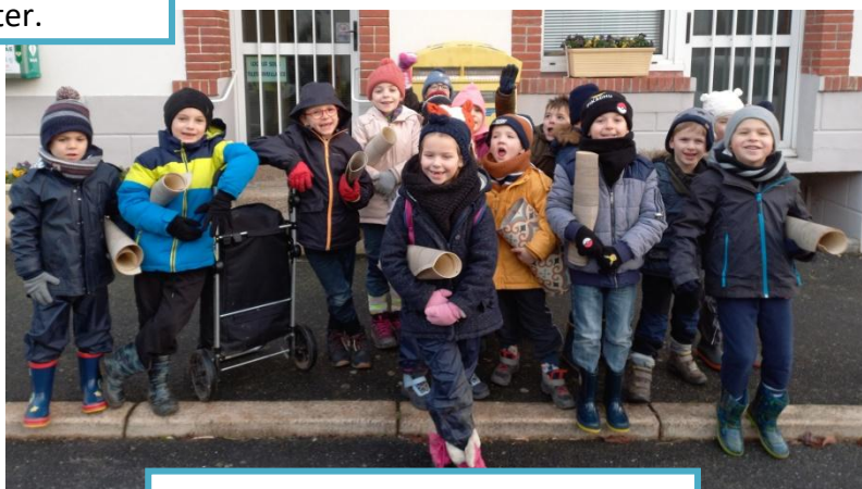
On va poster nos cartes de vœux.