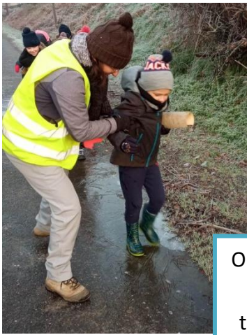
On profite des joies de la nature en hiver : glissades, gadoue, trouvailles magiques de glaçons...