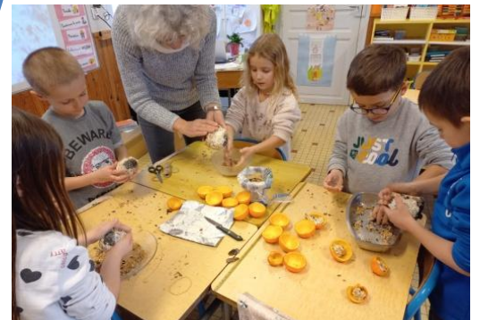
On prépare des boules de graisse pour les oiseaux.