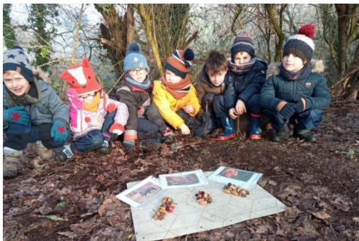
On prépare le restaurant des animaux qui ont du mal à trouver de la nourriture en hiver. Pour cela, il faut compter.

Qu'est-ce qu'on fait à l'école du dehors en hiver ?