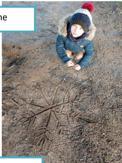
On travaille la symétrie, les doubles en mathématiques