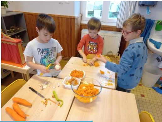
On prépare la soupe pour la manger au bois le lendemain afin de se réchauffer.