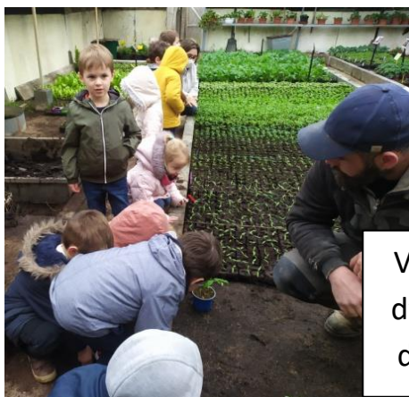
Visite de la serre d'un horticulteur de la commune.

Voici quelques photos illustrant nos activités :